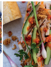
Paté de khao jee